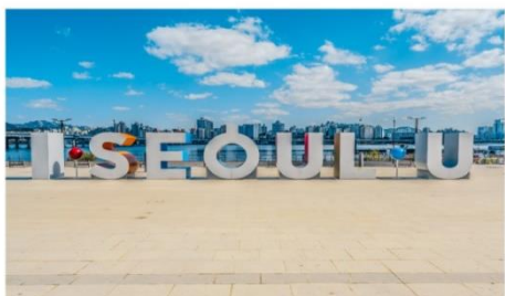
ถ่ายรูปกับป้าย I SEOUL U