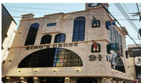
คาเฟ่แฮร์ฟอตเตอร์