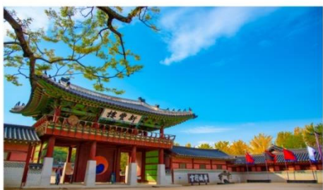
เข้าชม ป้อมปราการฮวาซอง