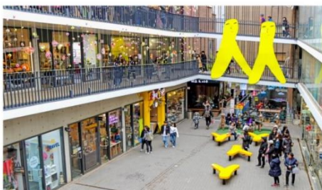
ย่านอินชาดง