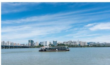
ส่องเรือสำราญแม่น้ำฮัน