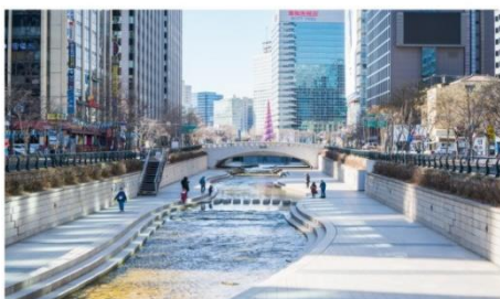
คลองชองกายซอน