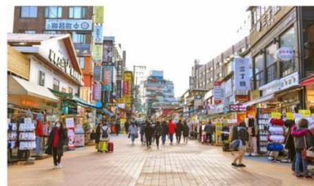
ย่านฮงแด