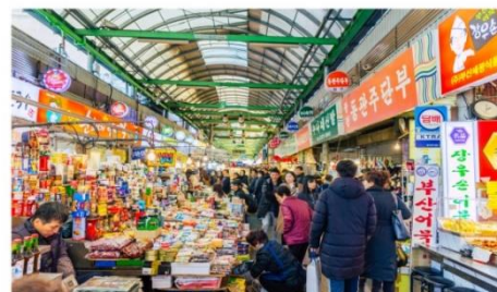
กวางจิงมาร์เก็ต